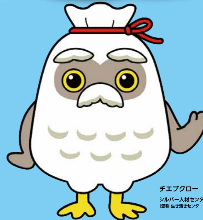
チエブクロー シルバー人材センター (愛称 生き活きセンター)