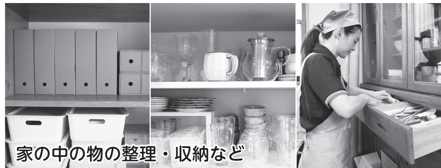
家の中の物の整理・収納など

家庭内での片付けを想定した整理と収納の基本を、整理収納アドバイザー2級のカリキュラムに沿って習得し、家事援助サービス分野での就業を目指します。